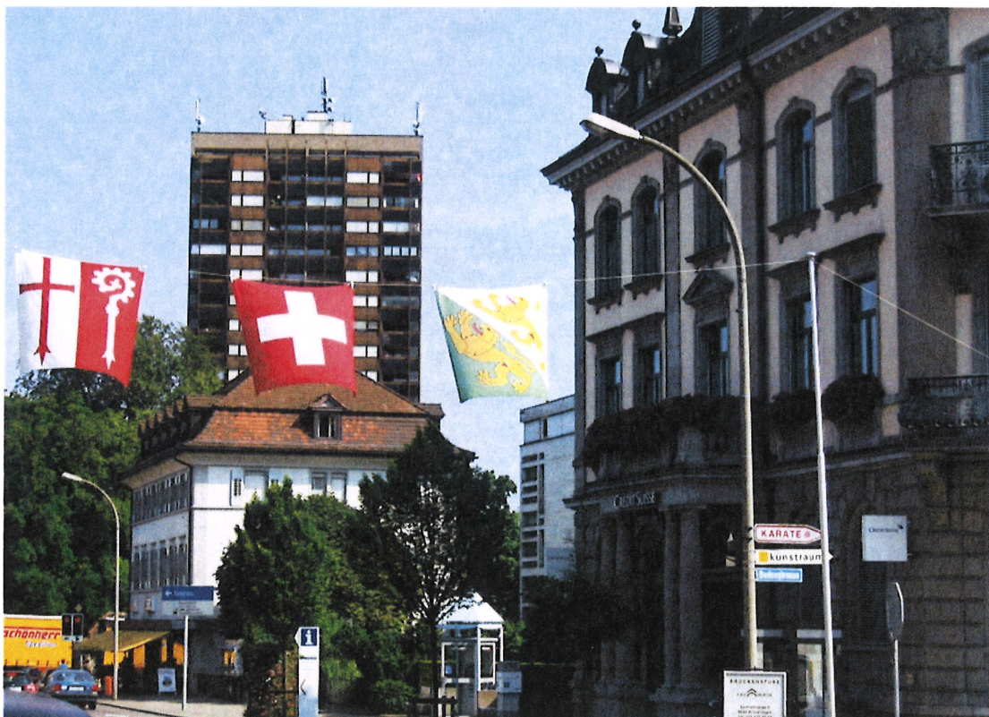
Stand 03. Juli 2019

Vom Stadtrat in Kraft gesetzt am: 14. APR. 2020 auf den: 01. JUNI 2020